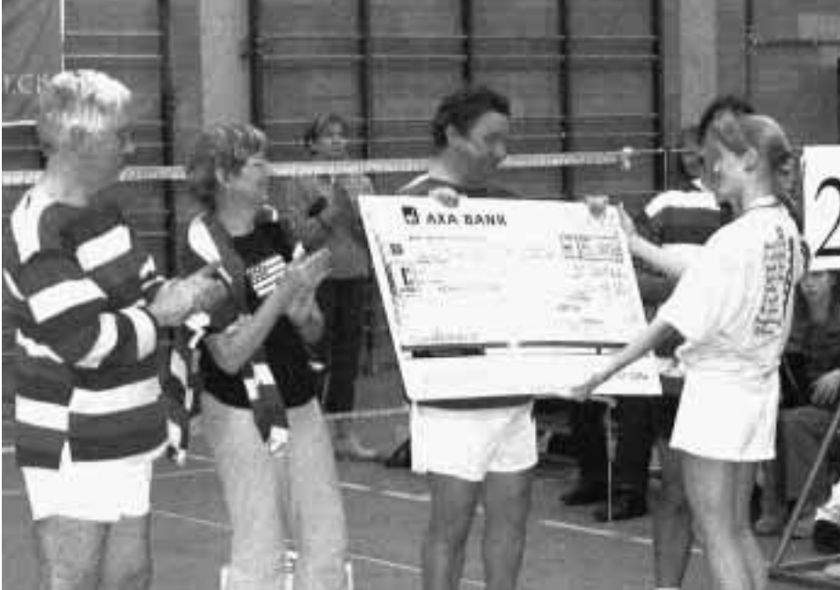
glunderende gezichten bij het overhandigen van de cheque.

Meer dan 180 spelers, heel wat bezoekers en bakken ambiance! Naast het sportieve gebeuren was er gezorgd voor veel animatie: een gezellige tapas-bar, muziek, leuke verkleedpartijen, verzorgde maaltijden,... Dankzij de inzet van veel vrijwilligers en de steun van de directie van PC Caritas werd het een overweldigend succes.