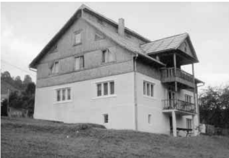
het vakantiehuis te Ilva Mica

De groep zal kunnen verblijven in het vakantiehuis; we zullen wel zelf voor mondvoorraad moeten zorgen. Een aantal mensen zullen wellicht in het voorjaar poolshoogte nemen van de situatie teneinde in augustus niet voor verrassingen te staan. Dit verkennend bezoek zal uiteraard ook nuttig zijn voor de voorbereiding van het werkprogramma, want veel aangepaste werktuigen zullen allicht niet voorhanden zijn en het zal dus zaak zijn om niets te vergeten mee te brengen uit België.