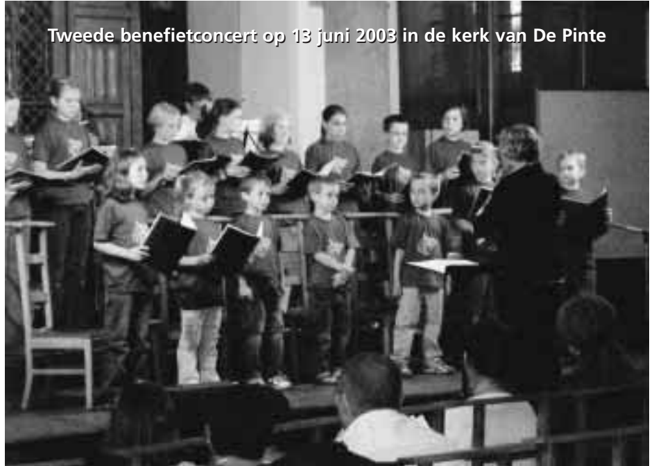
Tweede benefietconcert op 13 juni 2003 in de kerk van De Pinte

Na het succesvol optreden van El Grillo en 'Vier op een Rij' vorig jaar, voorafgegaan door het jongerenkoor Jubilate, besloten we een traditie te maken van een jaarlijks concert.