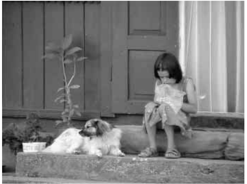
Meisje in de Maramures

Op 2 september jongstleden werd de vzw NONA aangenomen als lid van de Gemeentelijke Raad voor Cultuurbeleid (GRC) van De Pinte. Met deze aansluiting wil onze vereniging eerst en vooral een signaal geven naar de bevolking