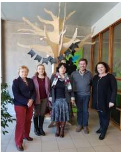
In de ziekenhuisschool UZ Leuven.

Na deze gevulde en drukke week, was het terug tijd voor ontspanning in Brugge met een wandeling in het historisch centrum, een bezoek aan het Groeningemuseum en aan de Heilige Bloedkapel.